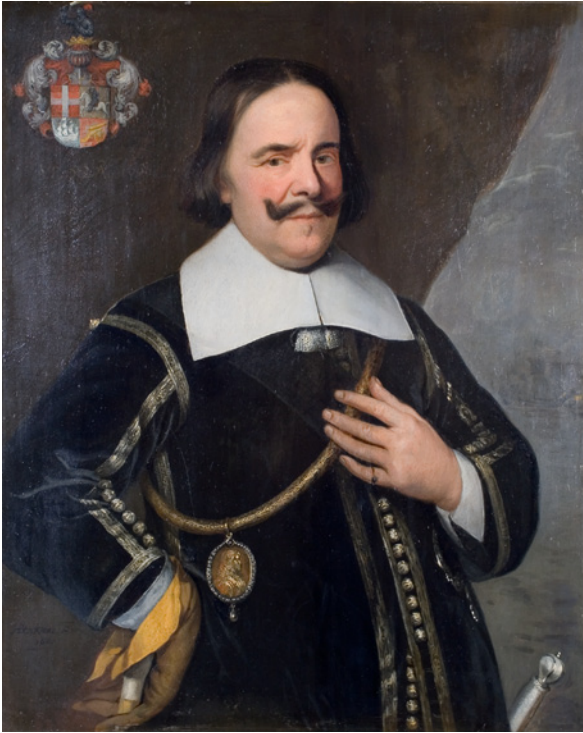
Afb. 15. Portret van Michiel de Ruyter.

bij de Staten-Generaal inbracht. Het besluit om De Ruyter een andere opdracht te geven werd in de vergadering niet besproken.